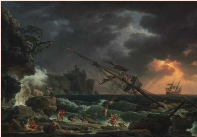
Claude-Joseph Vernet , The Shipwreck , 1772

Claude Joseph Vernet (1714-1789) fue un pintor francés que obtuvo fama y notoriedad por sus paisajes de puertos y tormentas marinas. Sus obras fueron especialmente apreciadas en el romanticismo (s.XIX) precisamente por algo que él nunca imaginó. Pintaba paisajes sin más pretensión que una idea puramente decorativa, pero los románticos interpretaron que estas pinturas reflejaban la fuerza de la naturaleza en similitud con la lucha interna del ser humano.